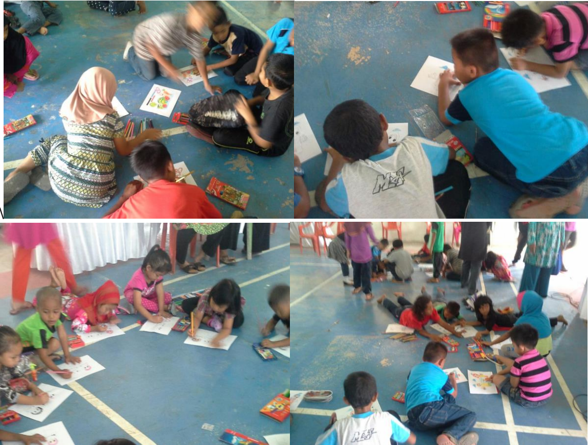
Pelajar Mengikuti Pertandingan mewarna anjuran Pi1M