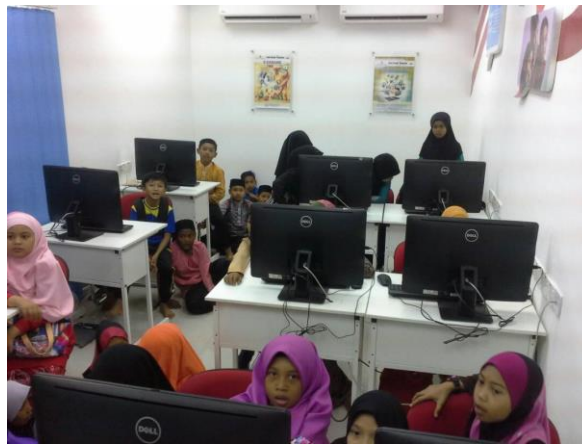
1.1 Peserta sedang mengikuti kelas Desktop Publishing: Pengenalan Komputer, Microsoft Office