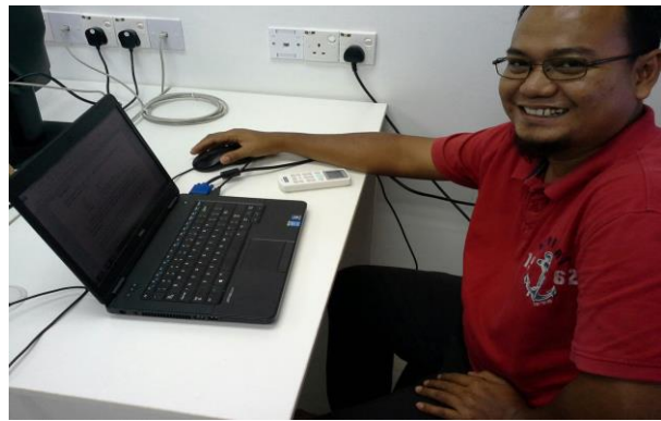
Penolong Diberi Maklumat dan panduan berkenaan Intel Easy Step