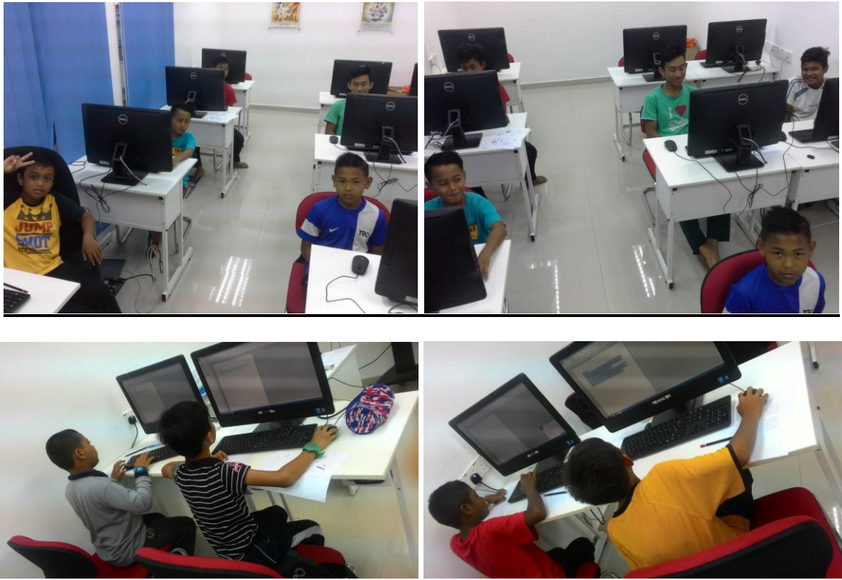
1.1 Peserta sedang mengikuti kelas Desktop Publishing: Pengenalan Komputer, Microsoft Office