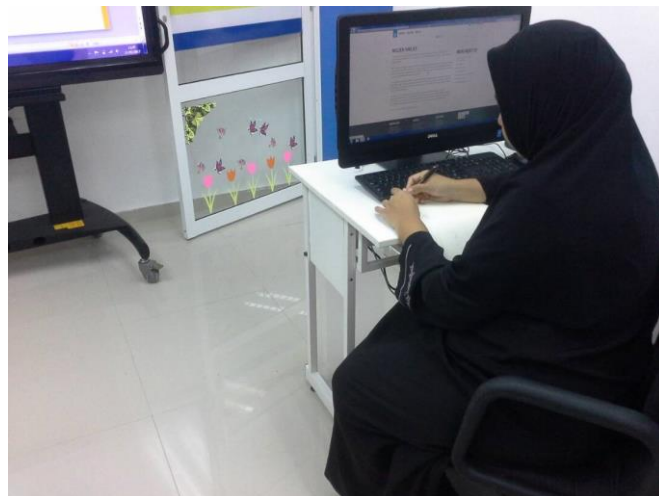
2.1 Peserta mendaftar dan menerima risalah Keusahawanan