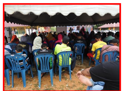
2.1 Peserta sedang mengikuti Taklimat Advokasi dan Bengkel Klik Dengan Bijak