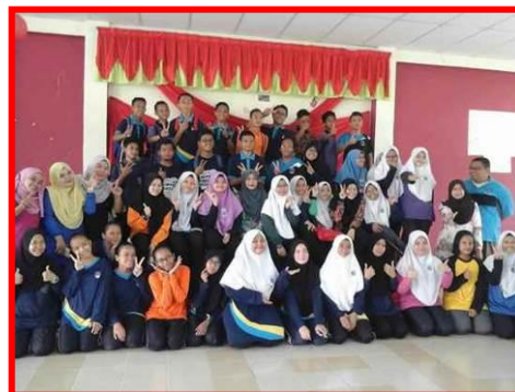
1.1 Peserta sedang mengikuti program e-pembelajaran.