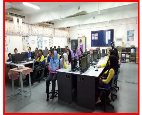
3.1 Peserta sedang mengikuti kelas Microsoft office Word 2010.