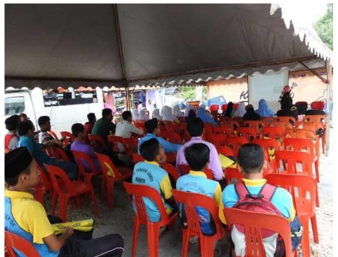
2.5 Peserta program Hari Bersama Komuniti PI1M Kg Pianggu sedang mendengar Taklimat Advokasi daripada petugas PI1M.