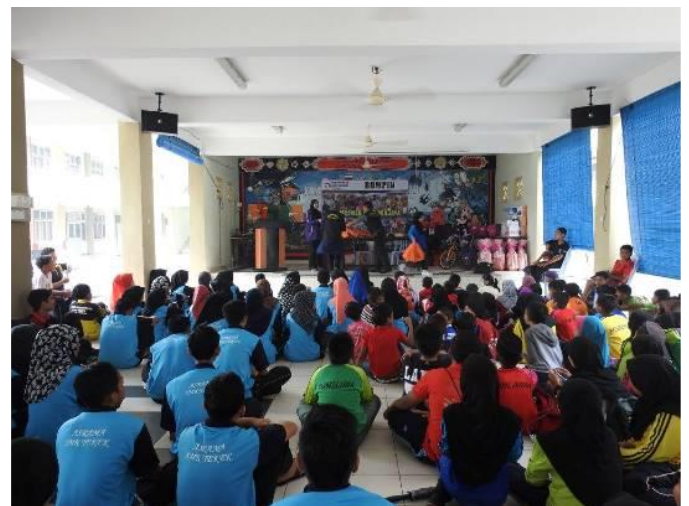
2.6. Program Advokasi di SMK Tekek, Tioman untuk pelajar SK Tekek dan SMK Tekek dan Komuniti Setempat.