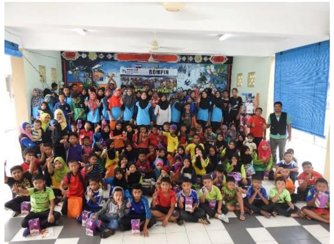
1.5 Peserta sedang mengikuti program e-Pembelajaran di SMK Tekek semoena program Usahawan anjuran Usahanita dan Pusat Internet 1Malaysia Daerah Rompin.