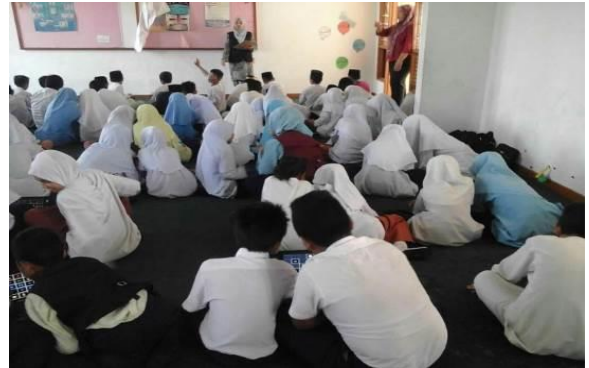
2.0 Peserta Sk Kg Pianggu sedang mengikuti Taklimat Advokasi dari petugas PI1M.