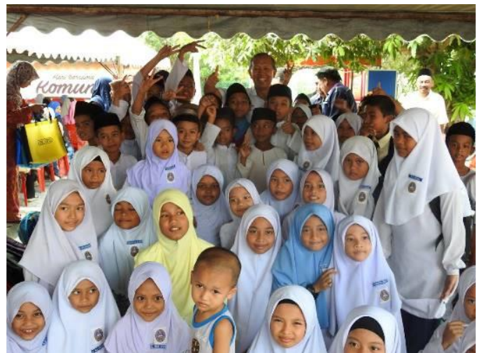
1.4 Peserta sedang mengikuti program e-Pembelajaran sempena program Hari Bersama Komuniti di PI1M Kg Pianggu