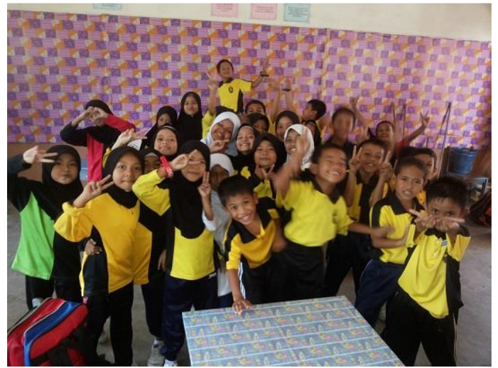
1.0 Peserta Sk Kg Pianggu sedang mengikuti program E-pembelajaran.