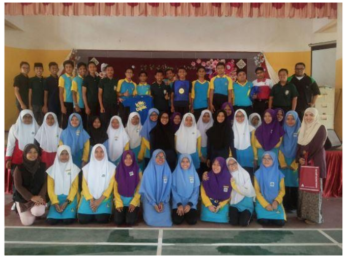
1.1 Peserta SMK Tg Gemok sedang mengikuti program e-Pembelajaran.