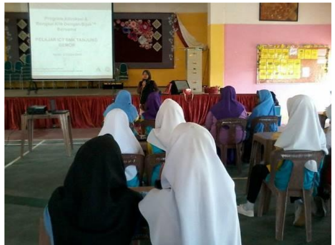
2.1 Peserta program advokasi dan bengkel klik dengan bijak pelajar Tingkatan 2 dan 4 SMK Tg Gemok