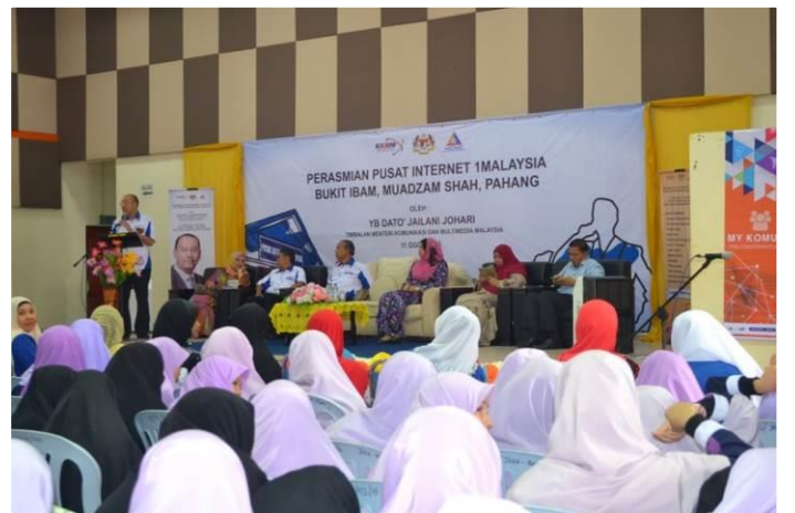
2.2 Peserta sedang mendengar taklimat advokasi sempena Majlis Perasmian Pusat Internet 1 Malaysia Bukit Ibam, Muadzam Shah, Pahang.