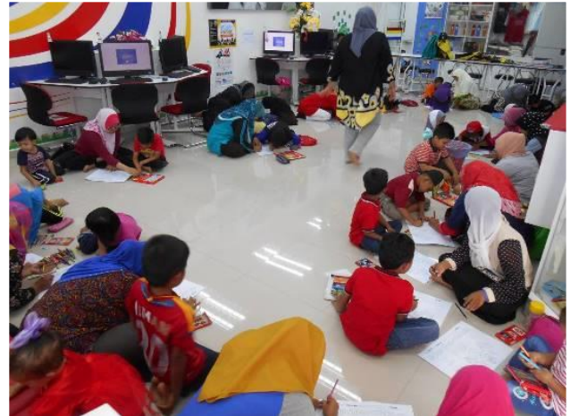
2.4 Peserta sedang mendengar taklimat Advokasi sempena program Mewarna merdeka ibu bapa dan kanak kanak di PI1M Felda Selendang 1/2